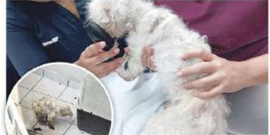
PESE a los esfuerzos de los médicos veterinarios, "Puchi" no pudo recuperar su salud.

BOCA DEL RÍO LIDYVET MURILLO IMAGEN DEL GOLFO El pasado 18 de abril se logró el rescate de "Puchi" una perrita que estaba siendo víctima de maltrato animal en la colonia Adalberto Tejeda, en el municipio de Boca del Río, sin embargo, durante la noche del viernes 26 de abril, esta falleció debido a las condiciones en que fue encontrada. A través de un tweet, el alcalde de Boca del Río, Juan Manuel de Unánué Abascal confirmó el deceso de la cachorrita, asegurando que debe haber sanciones severas para quienes son sus dueños, por mantenerla en las condiciones deplorables en las cuales fue rescatada. El caso de maltrato animal de "Puchi" había sido expuesto en redes sociales por algunos vecinos, quienes decidieron informar al ayuntamiento de Boca del Río sobre las condiciones de vida que se le daba a esta mascota. "Puchi" había sido llevada al Hospital Veterinario Canales, sin embargo, debido a su estado de salud, esta no