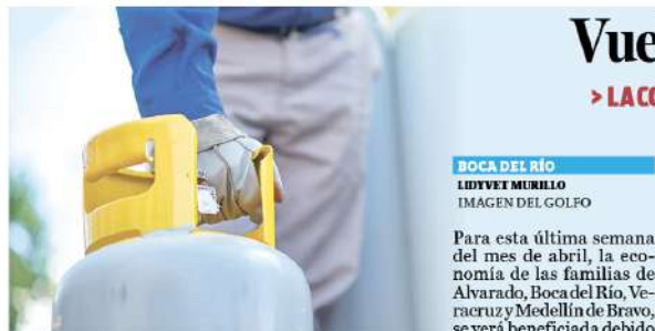
LOS PRECIOS del gas LP en Veracruz, Boca del Río, Alvarado y Medellín de Bravo se mantienen estables.

logía del Ayuntamiento de Veracruz solucionó el problema y restauró la funcionalidad normal del sitio web lo antes posible. Los ciudadanos tuvieron que buscar información oficial a través de otros canales de comunicación, como las redes sociales oficiales del Ayuntamiento y los medios de comunicación locales. Cabe mencionar que a la 13:15 horas la página fue restablecida.