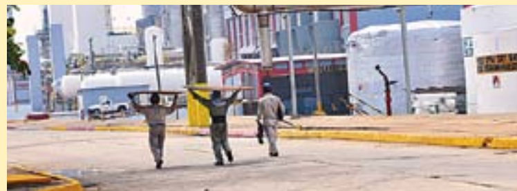
ROCÍO NAHLE dijo que iniciará el rescate en Coatzacoalcos, no porque haga tres complejos de Pemex, sino porque hay profesionistas competentes para hacer estos trabajos.