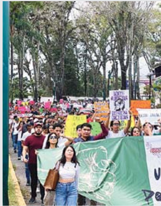
JÓVENES TOMAN LAS CALLES A FAVOR DE LA REFORMA. Al menos 31 movilizaciones se realizaron a favor de la Reforma al Poder Judicial en todo el país, en el marco de la discusión de la misma en la Cámara de Diputados.

Actualmente, los ministros son propuesta del presidente mediante terna, y el ganador debe ser respaldado por al menos dos terceras partes de los senadores, mientras que magistrados y jueces son nombrados por el Consejo de la Judicatura Federal.