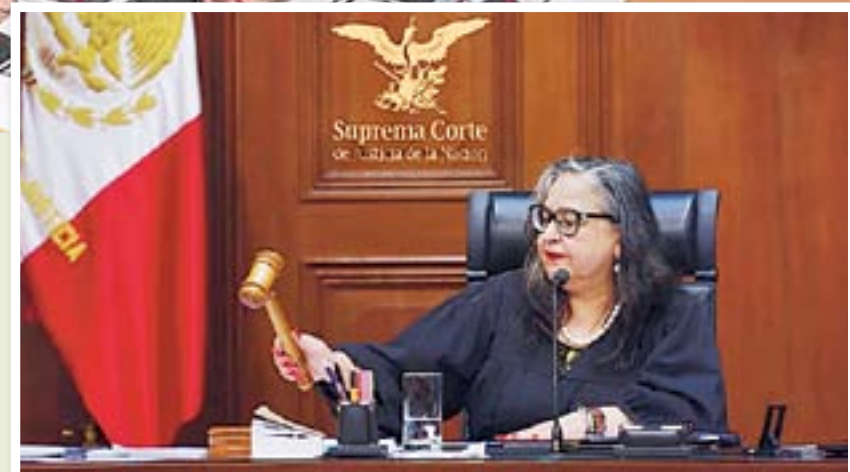
REVÉS A LA MINISTRA PRESIDENTA Norma Piña, quien no logró que se avalara la mayoría calificada con seis votos en lugar de ocho por lo que se desestimó la invalidez de la Reforma al Poder Judicial.