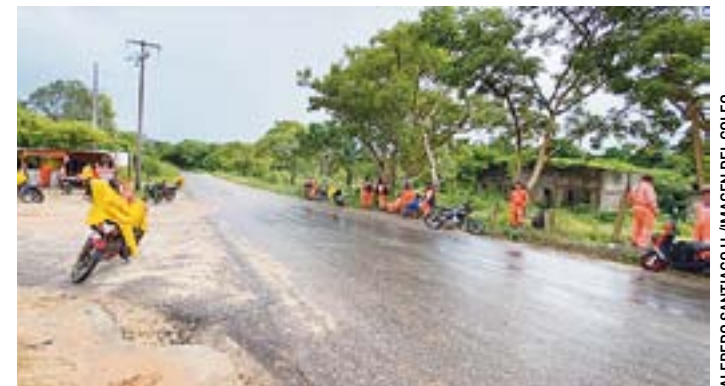
HACE UN MES se manifestaron con una jornada de "brazos caídos", pero no les dieron solución.

a la población a mantenerse alerta, evitar confiar en desconocidos que ofrezcan tratos irregulares y reportar de inmediato cualquier actividad sospechosa.