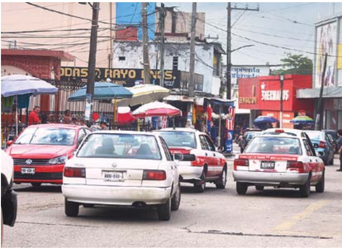
LOS POLICÍAS MUNICIPALES a pesar del operativo no lograron detener a ninguna persona.

■ Las estafadoras convencieron a la ciudadana de entregarles su bolsa a cambio de un documento que, supuestamente, garantizaba el cobro de 75 mil pesos