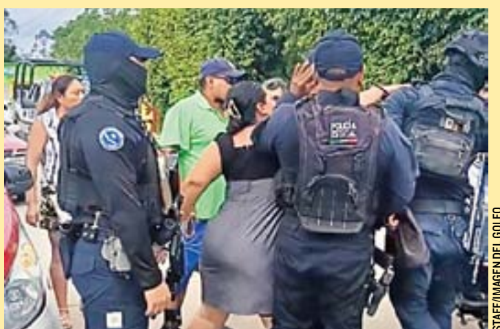
HASTA EL MOMENTO no se ha sancionado a los policías a pesar de las acusaciones.

ciones contra los elementos responsables de las agresiones, lo que ha generado un