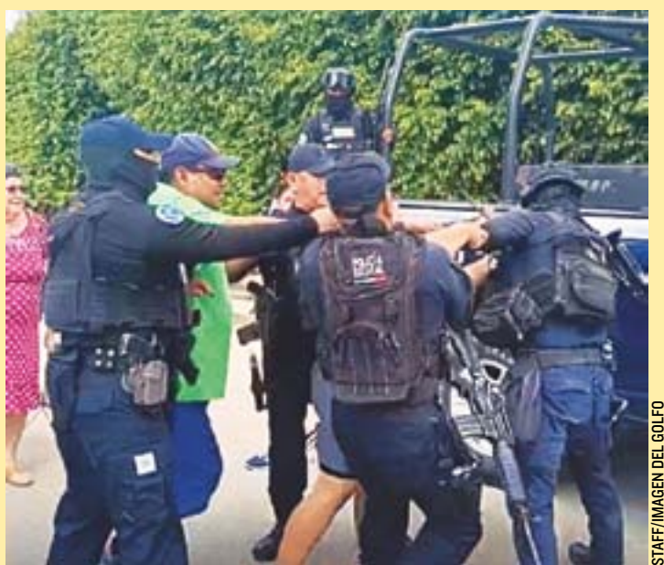
LA MUJER GOLPEÓ a los uniformados, tras los abusos cometidos.

A pesar de la gravedad de los hechos, hasta el momento no se han registrado san-