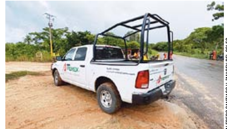
LOS OBREROS LABORAN en el campo Rabasa en la construcción del complejo prioritario de Pemex.

ambiente de desconfianza y malestar en la población choapense.