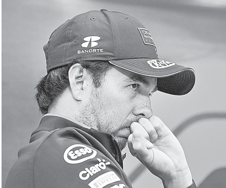
SERGIO PÉREZ CERRÓ una temporada de pesadilla en la Fórmula 1.

Al que sí rindieron honor por su gran campaña, fue a Max Verstappen, no como los Power Rankings F1, donde se impuso a Lando Norris, mientras que Charles Leclerc completó el