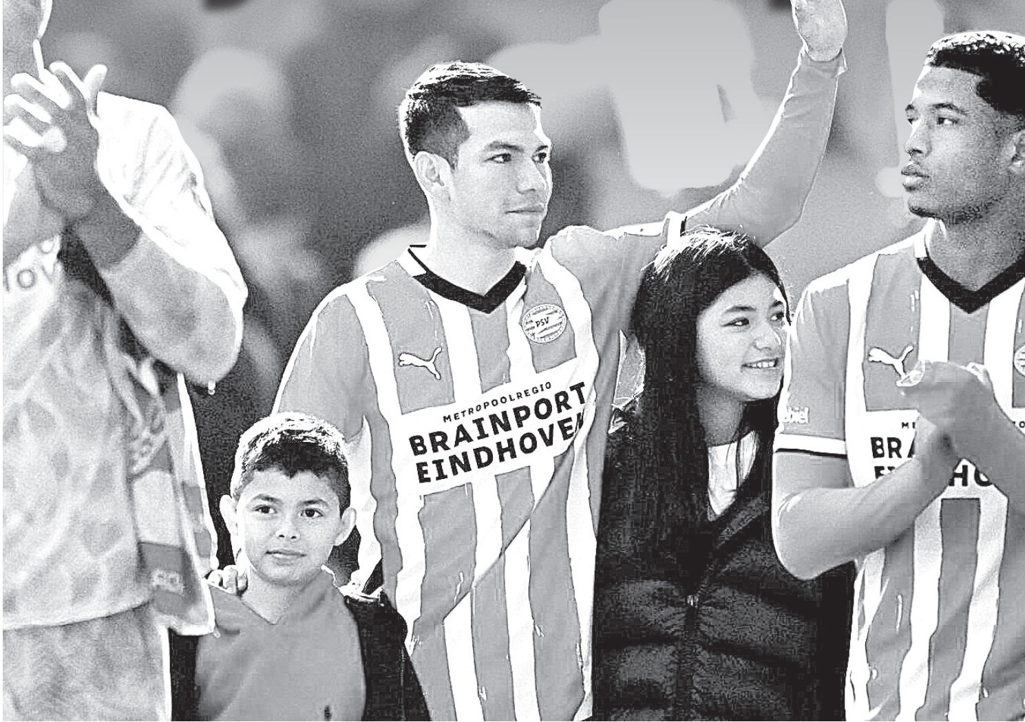
HIRVING LOZANO SE DESPIDIÓ de la afición del PSV en el duelo que ganaron al Feyenoord donde milita Santiago Giménez.

El atacante mexicano llegará a la MLS en 2025