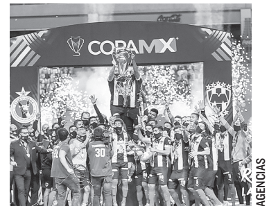
LA ÚLTIMA VEZ que se disputó el torneo fue en 2020 cuando se coronó Rayados.

La propuesta tiene como objetivo reunir a clubes de la Liga MX, Liga de Expansión, Liga Premier y Tercera División, permitiendo que equipos más pequeños sueñen