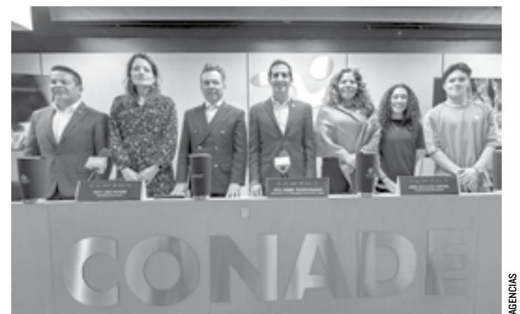
ENCABEZADOS por Rommel Pacheco, fue presentada la Copa del Mundo de Clavados 2025.

Tras la derrota, Osorio Arbeláez asumió la responsabilidad del resultado por los cinco cambios que hizo durante el partido, fiel a su filosofía de rotación de jugadores y de integración de jóvenes al proceso del primer equipo.