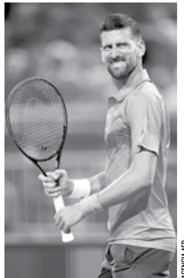
NOVAK DJOKOVIC alcanzó los cuartos de final de Miami.

Por distintas razones, Djokovic estuvo ausente del torneo de Florida desde 2019 pero ahora se encuentra a tres victorias de alcanzar el título número 100 de su legendaria carrera.