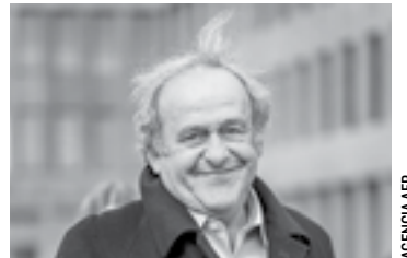
MICHEL PLATINI la libró.

Como en primera instancia en 2022, la corte de apelación extraordinaria del Tribunal Penal Federal reunida en Muttenz, en el noroeste de Suiza, desestimó la solicitud de la fiscalía que había requerido 20