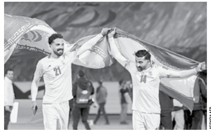
LA SELECCIÓN DE IRÁN se unió al grupo de calificados.

Así concluye una serie que marcará historia en Monterrey y México, además se espera que haya más sorpresas con la MLB y la Sultana del Norte para el 2026.