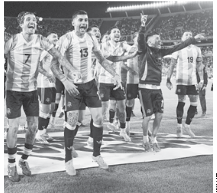
LA SELECCIÓN DE ARGENTINA reafirmó su condición de campeona del mundo frente a Brasil.

Con 4 partidos por delante de Eliminatorias, Brasil buscará amarrar su boleto al Mundial 2026 en la siguiente Fecha FIFA, misma que se disputará en el mes de junio.