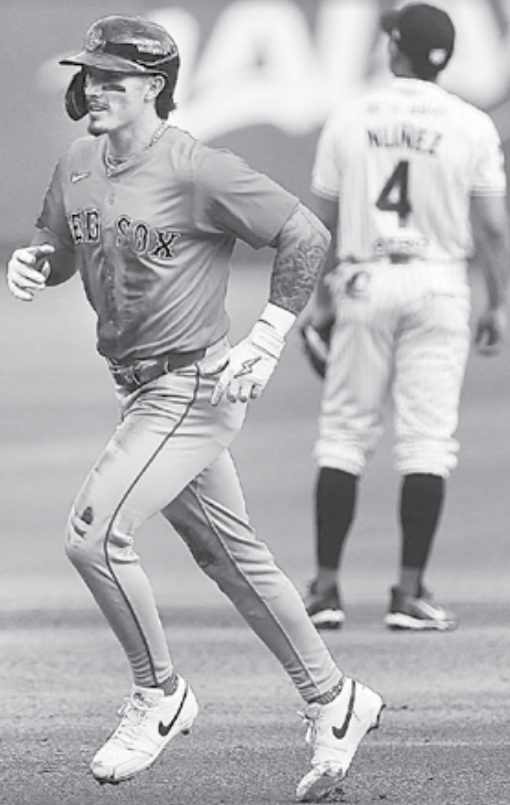
EN LA SEGUNDA NOCHE DEL REY DE LOS DEPORTES en Monterrey, los Medias Rojas ofrecieron otra demostración de nivel ligamagortisa. Boston cerró una visita de 22 carreras anotadas por 9 recibidas.