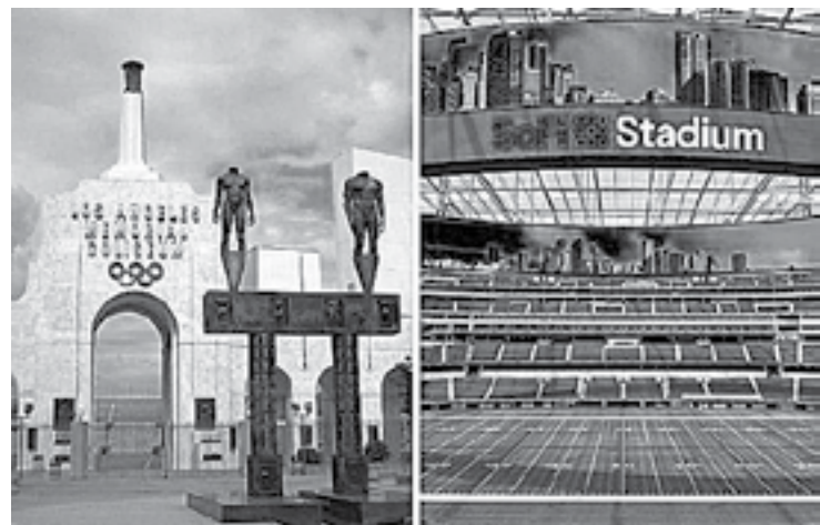
LA INAUGURACIÓN de los Olímpicos y Paralímpicos de 2028 se realizará en dos estadios.

referirán al recinto de SoFi, ubicado en Inglewood, cerca a Los Ángeles, por su nombre patrocinado, lo harán simplemente como "El estadio de Inglewood".