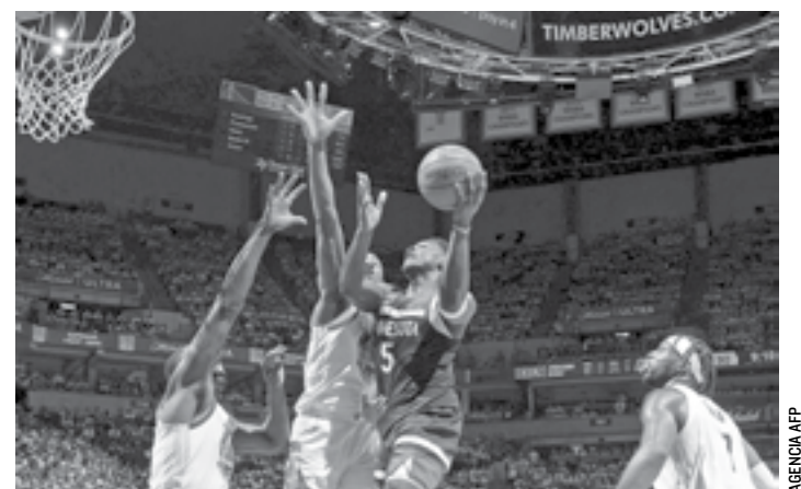
ANTHONY EDWARDS marcó 20 puntos en el triunfo de los Timberwolves.

El hecho de que estas dos escuadras sean las que se disputen la corona, no es casualidad. Ambos equipos dominaron el torneo de principio a fin. Las Águilas culminaron como lideresas con 41 puntos y siendo la mejor ofensiva. Hasta el momento, las dirigidas por Ángel Villacampa han realizado 71 anotaciones en 21 partidos disputados, promediando casi 3.5 goles por partido.