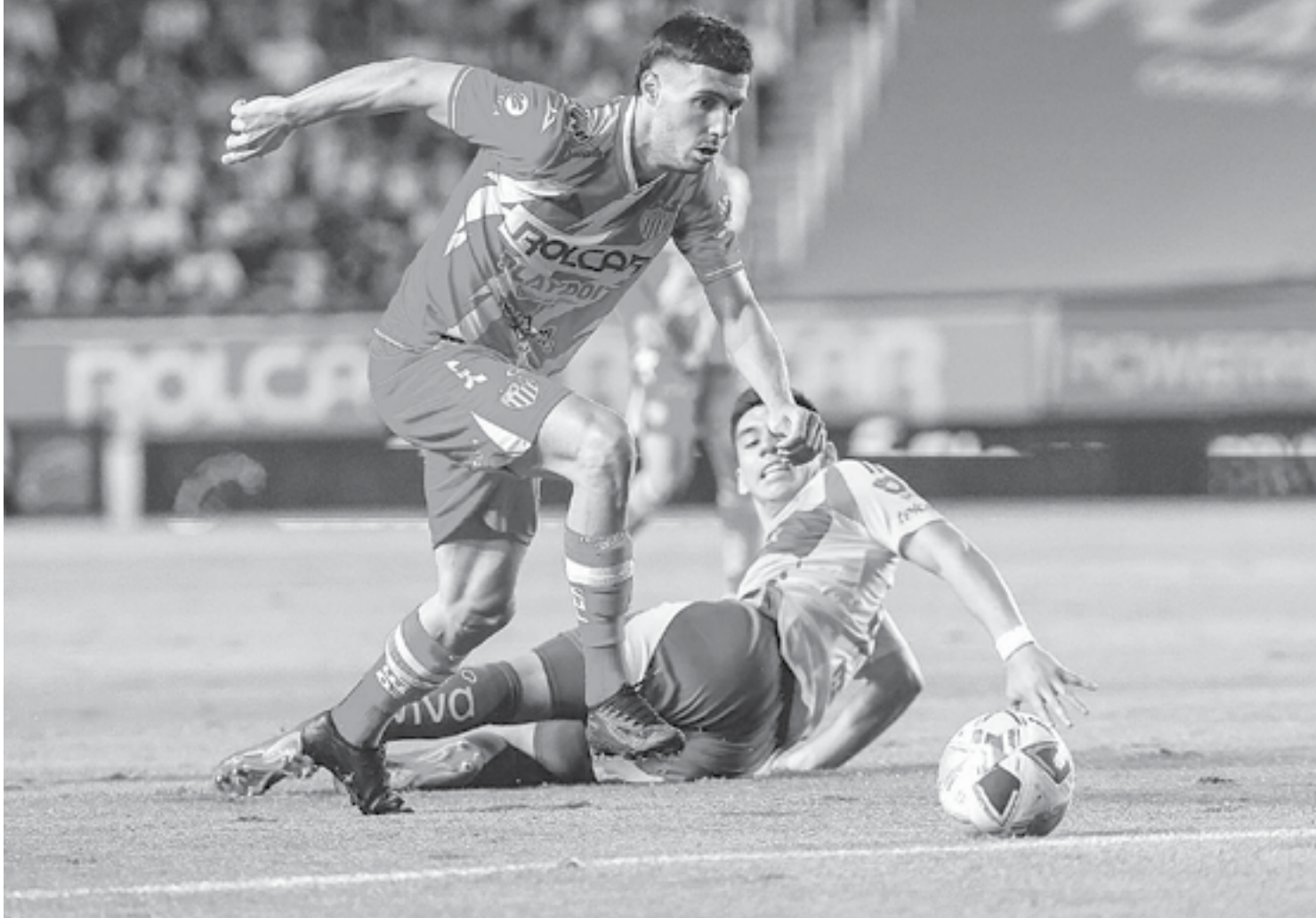
NECAXA NO PUDO APROVECHAR su localía y ahora tendrá que batallar en la casa de Tigres.