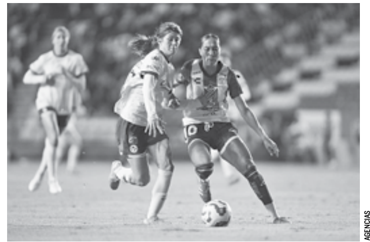
PACHUCA quiere desquitarse de las Águilas.

Fue hasta el segundo tiempo que Tigres se acordó de que también podía atacar, que tenía