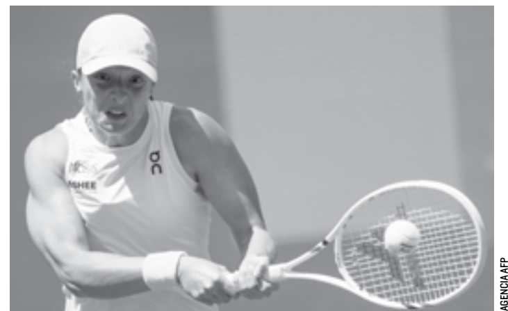
IGA SWIATEK superó sin problemas a la italiana Elisabetta Cocciaretto.

El atletismo se disputará en el coliseo y la natación en el estadio SoFi.